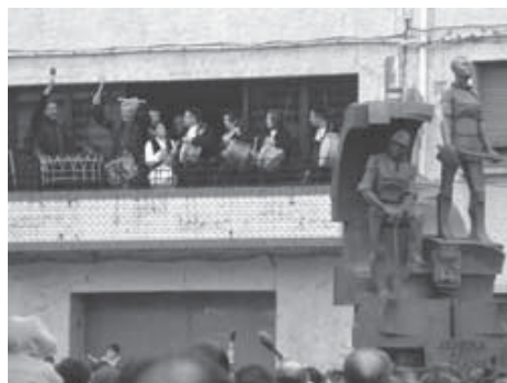
Tambores frente al Monumento al minero y al labrador

Al mismo tiempo preparar este pregón ha sido para mí un ejercicio de humildad: pienso que os voy a hablar