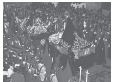
Procesión del Encuentro

Y para terminar, recordemos que la Semana Santa es tiempo de dolor y de esperanza, de muerte y resurrección de Cristo. Os pido que, en vez de aplaudir mis palabras, guardemos un minuto de silencio por las personas fallecidas y heridas por la barbarie terrorista, y tantas otras que en el mundo sufren y mueren a causa de guerras y otras violencias. Un minuto por la esperanza, un minuto por la paz.