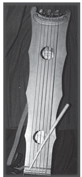
Salterio o chicotén