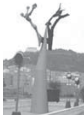
Monumento al Tambor y al Bombo

Me siento orgullosa de haber participado a la incorporación de la mujer