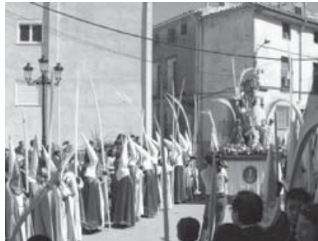
Procesión de Ramos

Y como culminación de estas tareas vemos ahora vuestra marca en los actos mismos : pregón, exaltación, procesiones, etc., pero también un