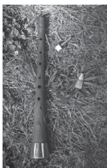
Gaita o dulzaina

Viene de la pag. 1 - La Orquestina del Fabirol