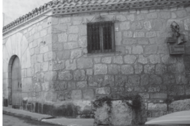
Plaza de José Iranzo, Andorra

A. de A. - Tu pueblo me recuerda siempre al famoso Pastor de Andorra. Lo he oído cantar un par de veces e incluso se le hizo un homenaje en Belmonte. Espero que sea profeta en su tierra.